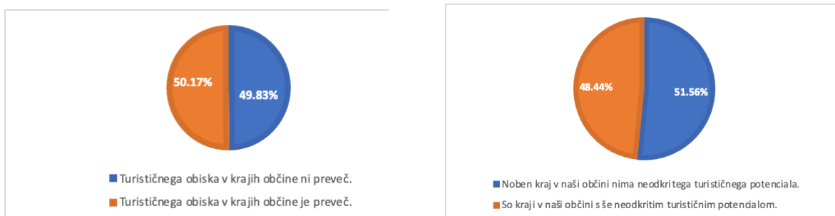
Slika 2: Mnenja o preobremenjenosti destinacije in potencialom za nadaljnji razvoj turizma.